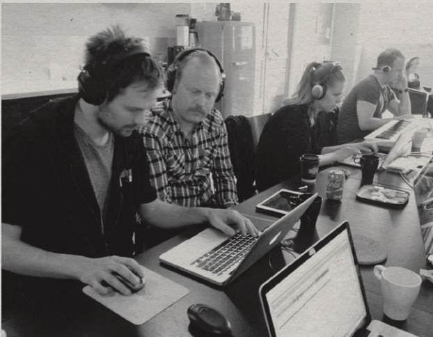
Kurs i studioproduksjon, mai 2015.