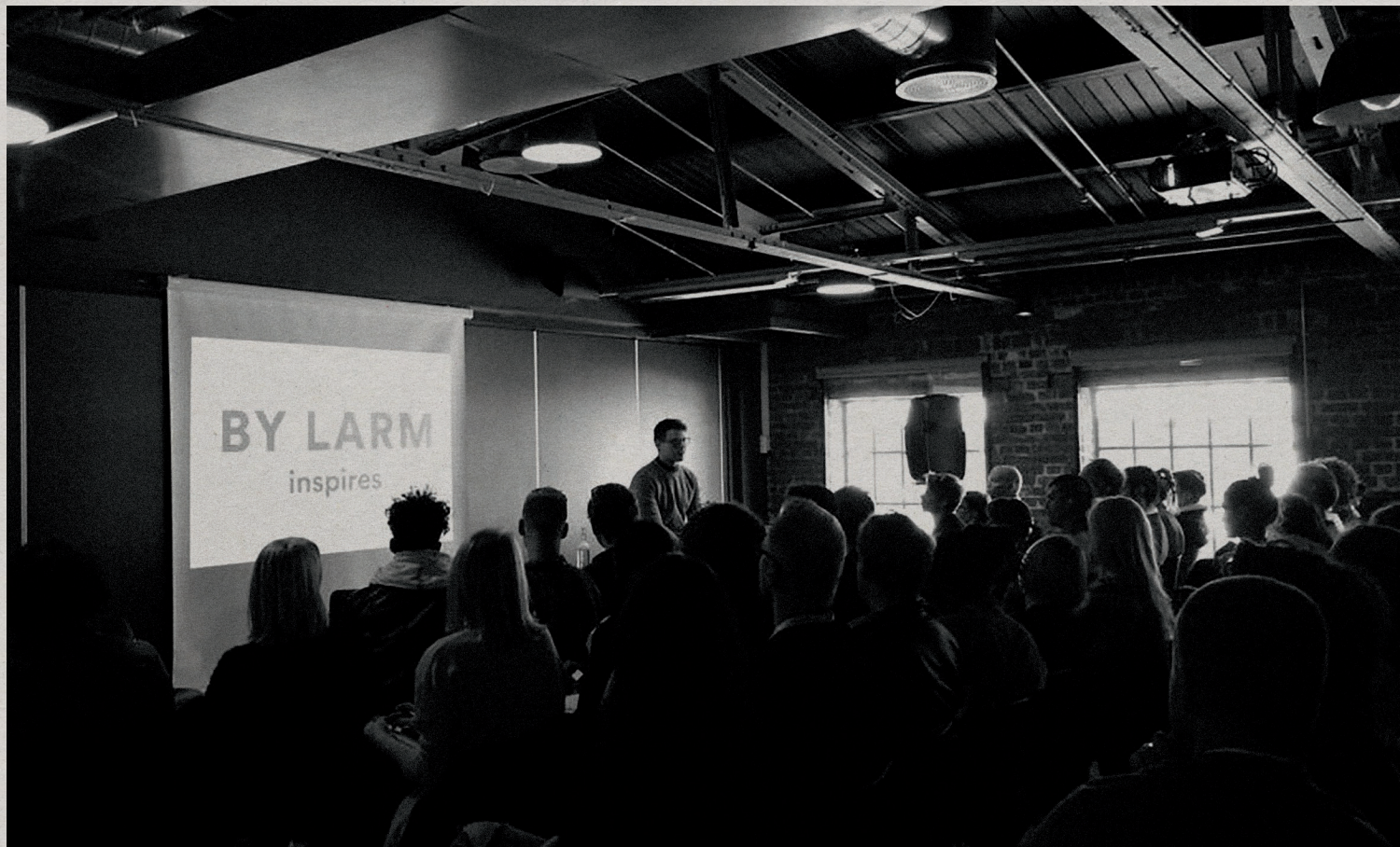
Eksportskolen på by:larm, mars 2015