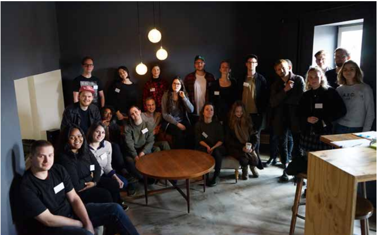
Masterdeltakere 2017 på samling i Berlin