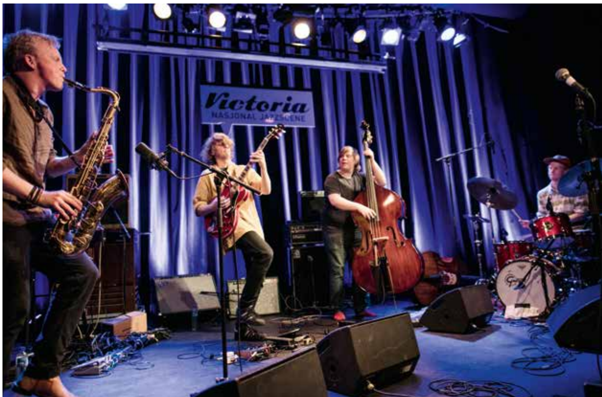
Master Oogway / Framtida i norsk jazz

■ Gjennom tilskudd fra Frifond v/Norsk jazzforum sendte vi en ung konsertprodusent fra Lillehammer til MoldeJazz' kursopplegg "Unge produsenter" vår og sommer 2017. Ung konsertarrangører fra hele landet deltok i programmet som ble avsluttet med konsert med Broen 18.juli i Teatret Vårt under MoldeJazz.