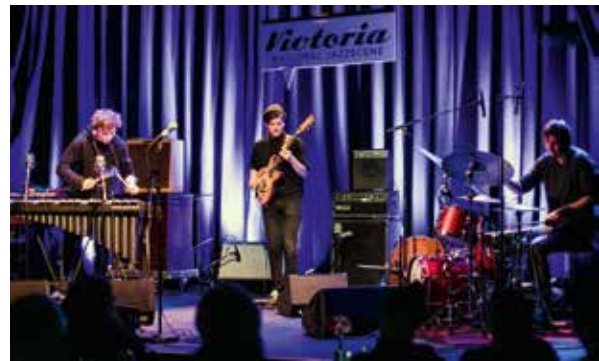
I Like To Sleep / Framtida i norsk jazz

Vi har mottatt prosjekttilskudd til gjennomføring av rekrutterings- og talentutviklingstiltak fra Oppland, Buskerud og Vestfold fylkeskommuner, samt Frifond, NOPA, Norsk jazzforum, KOMP/Norsk musikkråd, Musikkens studieforbund og Music Norway.