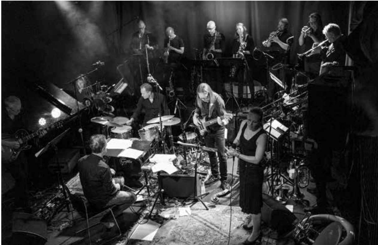
Ensemble Denada