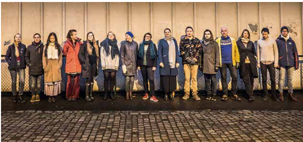
Oslo 14