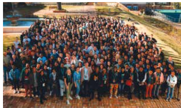
Standard Bank Jazz Festival/National Youth Jazz Festival i Sør-Afrika.