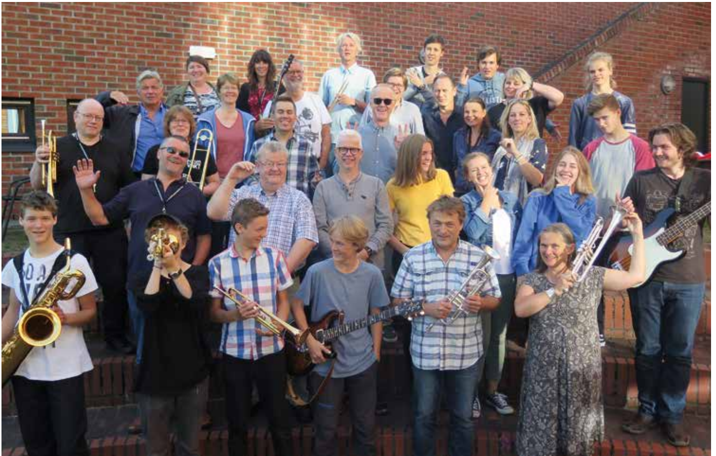
Storbandsommerkurs 2017