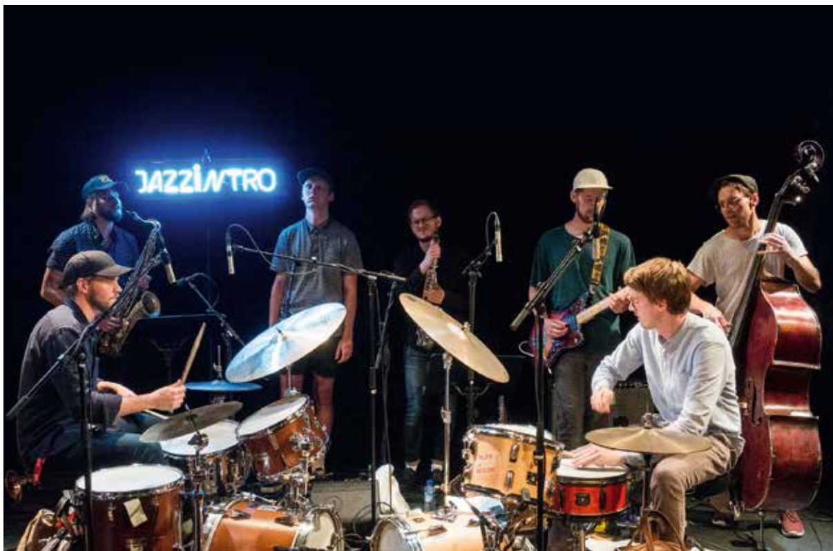
Megalodon Collective

Vi har mottatt prosjekttilskudd til gjennomføring av formidlings- og konsertproduksjon fra Oslo kommune, Norsk kulturråd, Norsk jazzforum og Music Norway.