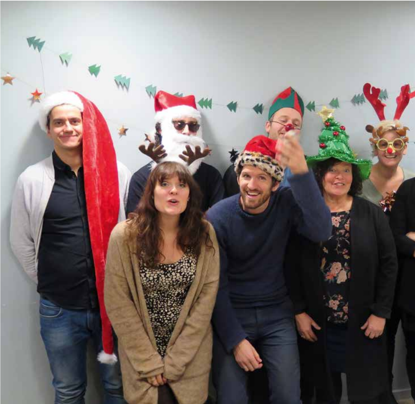
Styret og administrasjon i Østnorsk jazzsenter